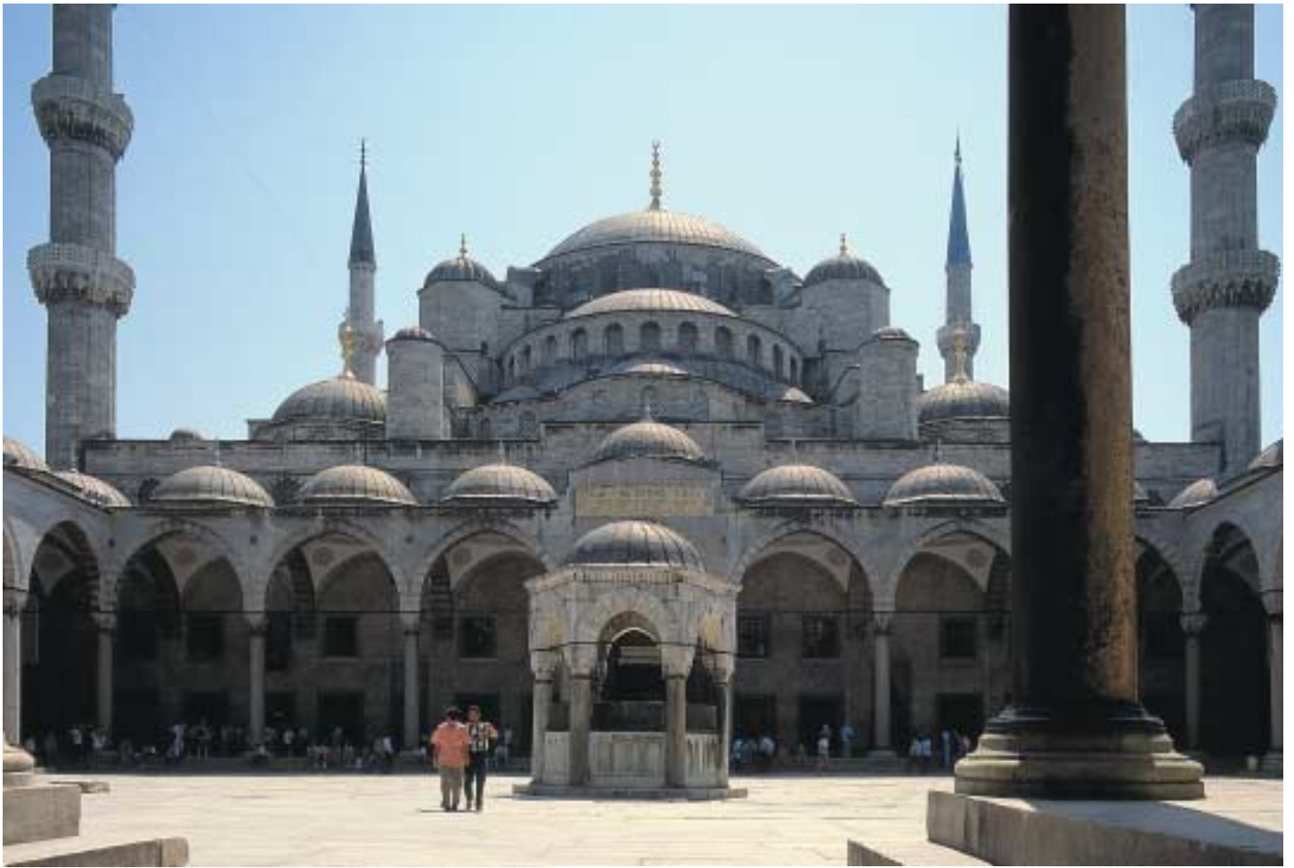
Hagia Sophia – die weltbekannte „Heilige Weisheit“.