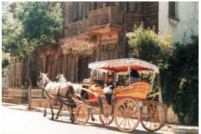
Bunte Verkehrsmittel auf den Prinzeninseln.

Zum absoluten Pflichtprogramm in Istanbul gehört auch der Topkapi Sarayi. Der Sultanspalast zählt zu den beeindruckendsten Sehenswürdigkeiten Europas. Hinter den unscheinbaren Mauern, die gleich hinter der Hagia Sofia beginnen, verbirgt sich ein wahrer Märchenpalast – der Inbegriff von orientalischem Luxus. Zahlreiche Sultane haben hier nach ihrem Geschmack gebaut und vergrößert. Trotzdem