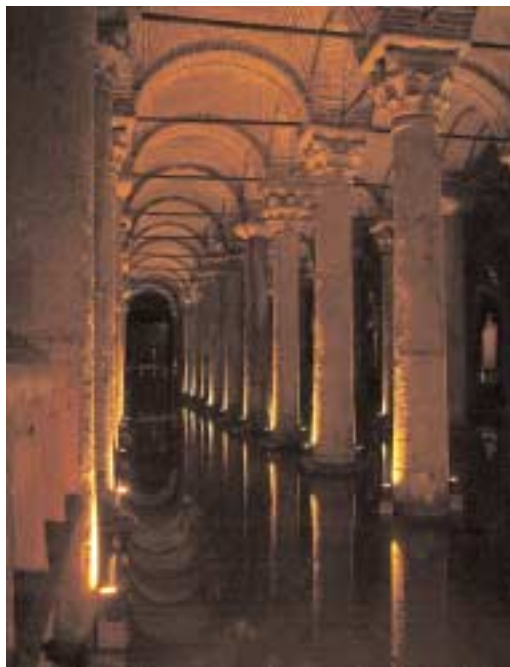
Yerebatan Sarayı – der Versunkene Palast.