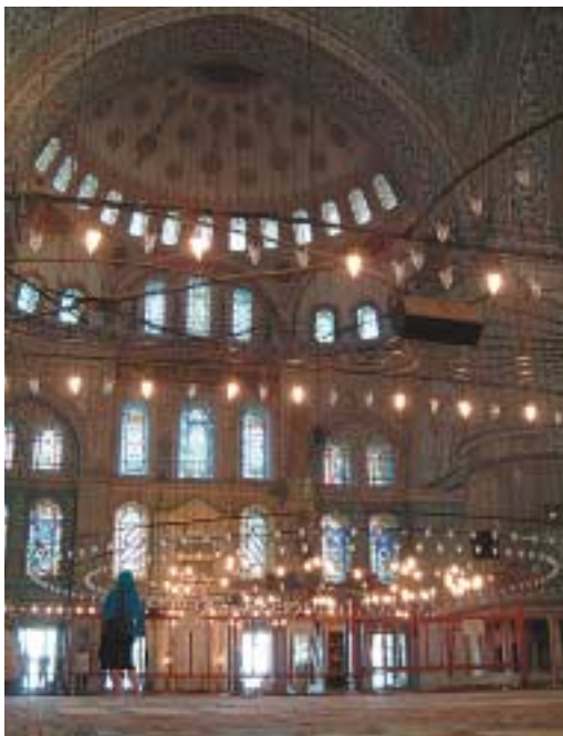
Besinnliche Ruhe in der „Blauen Moschee“.

einzig Moschee in Istanbul sechs Minarette, was auf ihre Bedeutung hinweist. In weltabgewandter Ruhe kann man hier auf weichem Teppich zum Staunen verweilen. Leuchter, die an meterlangen Ketten von der Kuppel hängen, tauchen den riesigen Raum in einen zarten Schimmer. Es lohnt sich durchaus die Moschee mehrmals zu besuchen, zumal sie direkt im Zentrum liegt. Zu unterschiedlichen Tageszeiten bietet sich immer ein neuer Anblick, wenn sich die Gläubigen hier zusammenfinden. Achten Sie aber darauf, dass zu den Hauptgebetszeiten, insbesondere beim Nachmittagsgebet am Freitag, neugierige Touristen unerwünscht sind. Es gibt unzählige Moscheen in Istanbul, denn zu den Gebetszeiten soll