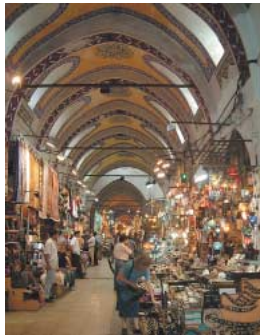
Der Große Basar lädt zum Handeln ein.

Brücke laden dazu ein. Nebenbei kann man das bunte Treiben beobachten. Verkäufer und Schuhputzer mit kunstvoll gearbeiteten Putzkästen suchen Kunden. Ununterbrochen lösen sich Schiffe ab und vor der Kaimauer schaukeln Fischbratboote. Nirgends auf der Welt gibt es leckerere Fischbrötchen als hier. Frisch gefangen landen die Meeresbewohner auf dem schwimmenden Grill und dann zwischen Gemüse und Brötchenhälften. Ein Genuss, den Sie nicht missen dürfen!