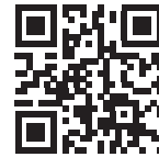
Infos zum Unternehmen

wertige Lösungen, um dem Zahnarzt die endodontische Behandlung zu erleichtern, den Workflow zu verbessern, dadurch Zeit zu sparen und gleichzeitig Behandlungsqualität und -erfolg zu steigern. Das sorgt für Sicherheit und „Gelassenheit inklusive“ bei Zahnarzt und Patient. „Endo Easy Efficient“ – das ist die Zukunft der Endodontie! <<<