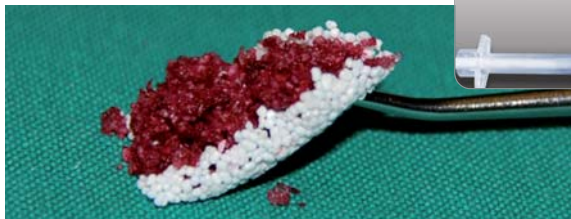
Flexible, poröse Schale – gemäß Dr. Stefan Neumeyer, Eschlikam.

450–1.000 \mu m stabilisiert mechanisch ideal bei hoher Porosität. Besonders eignen sich easy-graft® CLASSIC 250 und easy-graft® CRYSTAL 250 für die Anwendungen in der Socket Preservation im Prämolaren- und Frontzahnbereich sowie als effiziente Defektdeckung als Membranäquivalent bei großen Defekten. Wenn autologer Knochen und BGS Granulate, wie calc-i-oss™, in den Defekt eingebracht werden, kann man mit den easy-graft® 250 Produkten eine stabile und effiziente Defektdeckung erzielen. easy-graft® CLASSIC 250 und easy-graft® CRYSTAL 250 werden ab sofort in Verpackungseinheiten zu drei oder sechs Applikationen angeboten.