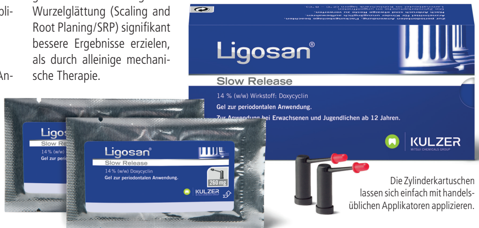
Die Zylinderkartuschen lassen sich einfach mit handelsüblichen Applikatoren applizieren.

Anwenderfreundliche Applikation Ligosan® Slow Release ist für die Anwendung in parodontalen Taschen optimiert. Dank seiner patentierten, fließenden Konsistenz können auch schwer zugängliche Bereiche therapiert werden. Das Gel ermöglicht eine unkomplizierte Behandlung und muss anschließend nicht entfernt werden.