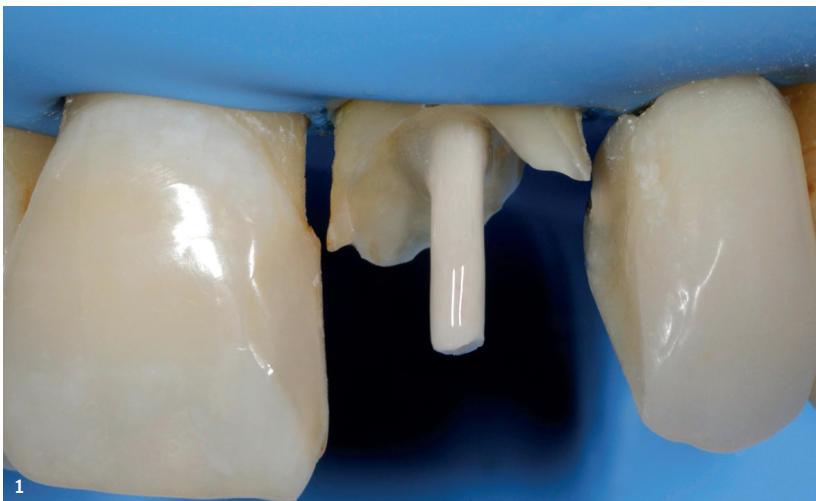
Abb. 1: Ein Glasfaserstift kann bei der Wiederherstellung von tiefzerstörten Zähnen für die nötige koronale Stabilität sorgen.

Mit der Core&Post Solution, Teil des Behandlungskonzepts R2C (Dentsply Sirona), steht jedoch ein System bereit, das alle Komponenten für den Stift-Stumpf-Aufbau bietet und zugleich eine Lichthärtung der Adhäsivschicht überflüssig macht. Die besondere Fähigkeit, die für einen sicheren Haftverbund über den gesamten Stift hinweg sorgt, nennt sich dementsprechend Dunkelhärtung. Eine endodontische Versorgung ist erst mit der Restauration der Zahnkrone erfolgreich abgeschlossen. Während sich bei geringeren Zerstörungsgraden eine direkte Versorgung eignet, kann bei größeren koronalen Defekten eine indirekte Restauration indiziert sein. Der Einsatz eines adhäsiven Stift-Stumpf-Aufbaus