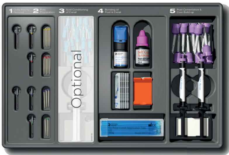
Abb. 3: „Superkraft“ Dunkelhärtung – Core&Post Solution macht im Rahmen einer Wurzelstiftsetzung sowohl die separate Ätzung des Wurzeldentins mit Phosphorsäure als auch eine Lichtpolymerisation der Adhäsivschicht überflüssig.

Die besondere Fähigkeit der Core&Post Solution zur sogenannten Dunkelhärtung macht die Befestigung von Wurzelstiften einfacher, sicherer und schneller. Das Komplettsystem bietet in maximal fünf Einzelschritten ein zusätzliches Maß an „innerer“ Sicherheit bei der Herstellung eines sicheren Haftverbunds von Glasfaserstiften – bis in die Tiefen des präparierten Wurzelkanals hinein (Abb. 3). Eingegliedert in das endodontisch-restaurative Behandlungskonzept R2C ist die Core&Post Solution zudem Teil einer praxisorientierten Richtschnur für erfolgreiche Behandlungen von der Wurzel bis zur Krone.