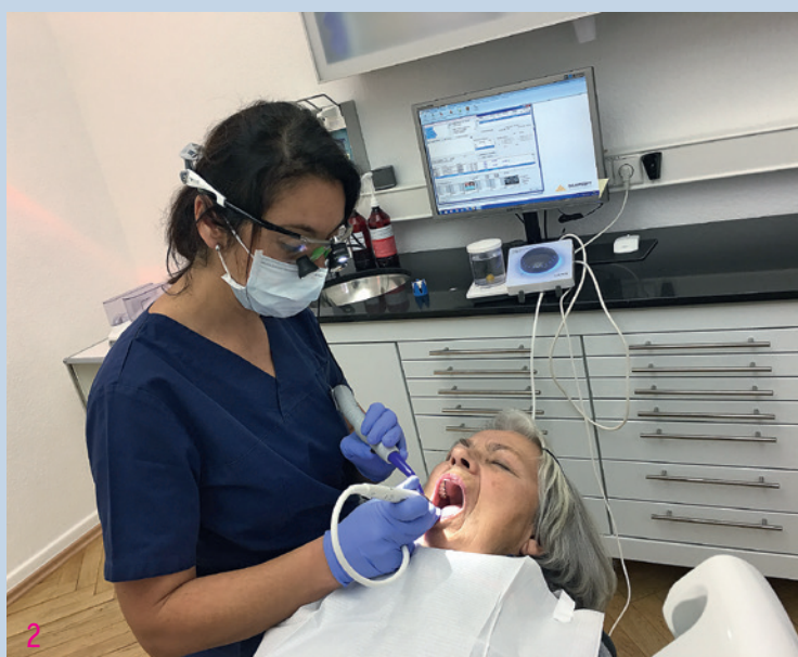
Abb. 2: Prophylaxebehandlung mit Newtron®-Ultraschall am Patienten.