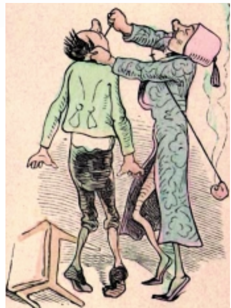
Schmerzbehandlung wie zu Wilhelm Buschs Zeiten findet zwar prinzipiell immer noch statt; doch ist ein Teil zahnärztlichen Handelns auch die interdisziplinäre Behandlung von Schmerzen im Gesichtsbereich.

den bis zum Tinnitus. Es findet sich immer die eine oder andere Variante, die vorgeblich zur Heilung oder doch zumindest zur Linderung der oben genannten Leiden bei-