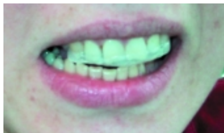
Dadurch wird ebenso eine andere Unterkieferposition vorgegeben, sowohl in statischer als auch in dynamischer Hinsicht.

auch der Umbau eines vorhandenen Zahnersatzes hier im Sinne einer Schienenvorbehandlung dienen kann.