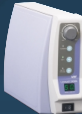
ULTIMATE 500K Knieststeuergerät

Sie können zwischen 2 Mikromotoren und 4 Steuergeräten wählen.