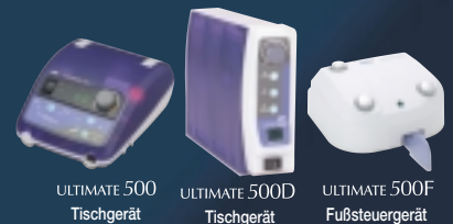
ULTIMATE 500 Tischgerät