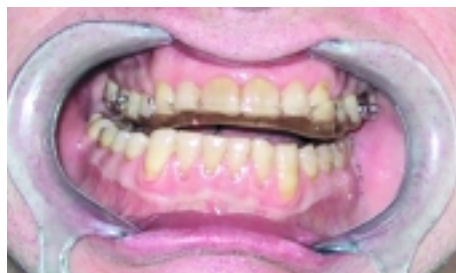
Die Wirkung einer Schienenbehandlung wird vor allem nach der Aufhebung der alten OK/UK-Relation durch das Anbieten einer neuen (Schienen-) Zahnreihe hervorgerufen.

Der Ersatz verloren gegangener Stützzonen gewährleistet eine gleichmäßige Abstützung des UK, in deren Folge sich wieder ein ausgeglichener Muskeltonus, eventuell der ursprüngliche vor Zahnverlust einstellt und den UK im Idealfall regelrecht positioniert. Dieses Ziel strebt eine Bissführungsplatte an, wobei hier erwähnt werden kann, dass