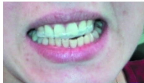
Neben dem Material ist auch die zierliche Gestaltung des Geräts für den Tragekomfort wichtig, ...

Sollte das Therapieziel darin bestehen, einen nach vorn verlagerten Diskus wieder einzufangen und in dieser Position zu fixieren, so besteht die Möglichkeit, durch eine Anordnung der „Schienenzahnreihe“ in einer den UK nach anterior verschobenen Lage die Kondylen ebenfalls nach vorn zu bringen, wieder auf die Disken aufsitzen zu lassen und eine neue UK/OK-Relation hier zu etablieren. Dabei muss aber zwingend beachtet werden,