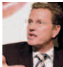
RA Dr. Guido Westerwelle – Bundesvorsitzender der FDP.