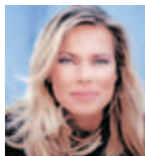
Nina Ruge – Gastgeberin des 7. Deutschen Zahnärzte Unternehmertages.