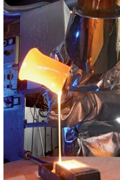
Die Glaskeramiken werden gemäß einem genau angegebenen Temperaturschema erzeugt (Foto: Jan-Peter Kasper/FSU).

Durch kontrolliertes Erhitzen auf rund 1.000 °C werden schließlich Nanokristalle erzeugt. Diese haben eine durchschnittliche Größe von höchstens 100 nm. „Sie sind zu klein, um das Licht stark zu streuen, und deshalb wirkt die Keramik transluzent wie ein natürlicher Zahn“, sagt Prof. Rüssel. Bis die Materialien aus dem Jenaer Otto-Schott-Institut als Zahnersatz praktisch zum Einsatz kommen kön-