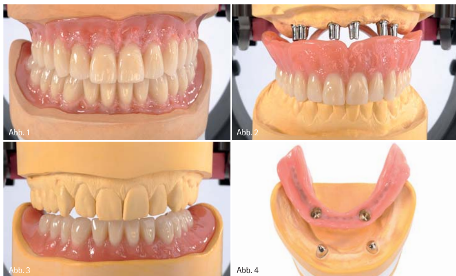
Abb. 1 und 2: Von der Totalprothese bis zur Oberkiefer-Implantatarbeit: Mit zeitgemäßen Konfektionszähnen wird der Zahntechniker allen Ansprüchen und Indikationen für zuverlässige und einfach aufzustellende Prothesen gerecht. – Abb. 3 und 4: Diese Teleskoparbeit bei geringem vertikalen Platzangebot wurde mit PALA Premium L19 in der Front harmonisch gelöst.

Bei 14 Round Table-Veranstaltungen informieren Experten von Heraeus in ganz Deutschland über die Vorteile zeitgemäßer Zahnlinien. Externe Referenten erläutern am eigenen Patientenfall, wie sie damit selbst in der implantatgetragenen Hybridprothetik alle ästhetischen und funktionellen Wünsche erfüllen.