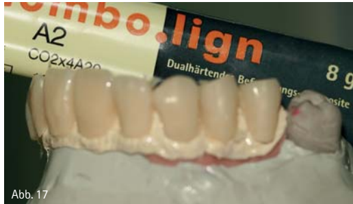
Abb. 14: Die Wachmodellation auf dem Muffelträger. – Abb. 15: Das in BioHPP-gepresste Gerüst direkt nach dem Ausbetten. – Abb. 16: Deckendes Auftragen des Opakers. – Abb. 17: Nach dem Befestigen der Verblendschalen wurden Fehlstellen nachgetragen und die Verblendung der Gingivabereiche konnte vorgenommen werden.