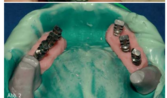
Abb. 1 und 2: Herstellung eines Modells mit Gingivamaske und herausnehmbaren Stümpfen (Molaren).