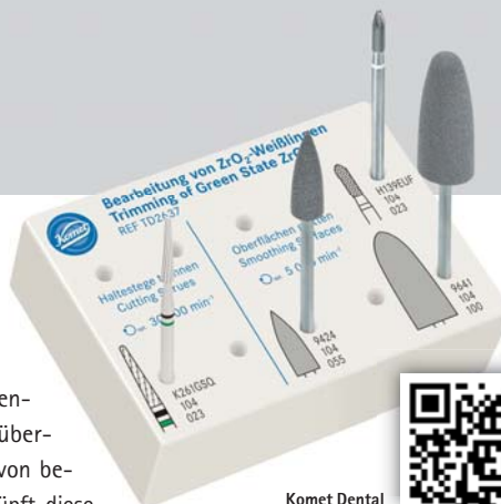
Komet Dental Gebr. Brasseler GmbH & Co. KG Infos zum Unternehmen

von „weichem“ Zirkonoxid kennen. Das Set liefert eine übersichtliche Zusammenstellung von bewährten Produkten und verknüpft diese mit neuen Anwendungsempfehlungen für die sichere Bearbeitung von Zirkonoxid im Weißzustand. Das bewusst kompakt gehaltene Set enthält alle relevanten Produkte vom Heraustrennen der Objekte aus dem Rohling bis hin zu Produkten für die Oberflächenglättung oder Randkorrekturen. Sichere Produktempfehlungen und spezielle Anwendungsparameter für die