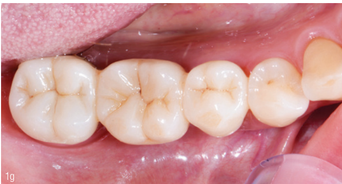
Abb. 1e: Ergebnis. Abb. 1f: Restaurationen aus dem Material können konventionell oder wie hier selbstadhäsiv befestigt werden. Abb. 1g: Noch schnell auf Hochglanz poliert und die Versorgung ist fertig.