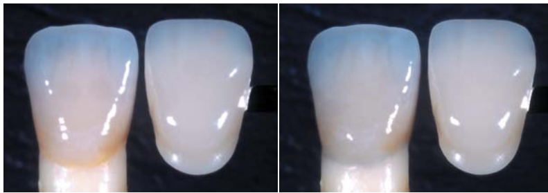
Abb. 3: Farbmodifikation durch gelblichen Zement (Farbe 7) bzw. grauen Zement (Farbe 11).