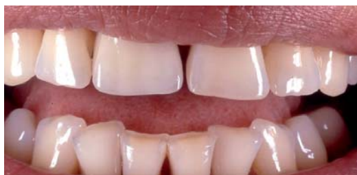
Abb. 1: Mit weißlichgelbem Zement (Farbe 3) zementierte Zirkonoxidkrone auf Zahn 11.

Die zurzeit am häufigsten verkauften Befestigungszemente sind der Zinkphosphatzement und der Glasionomerzement. Beim Zinkphosphatzement handelt es sich um ein Pulver, das hauptsächlich aus Zinkoxid und Magnesiumoxid besteht und nach dem Anrühren mit Phosphorsäure chemisch aushärtet. Früher wurde angenommen, dass die zum Anrühren von Zinkphosphatzementen verwendete Phosphorsäure pulpareizend sei. Die beim Einzementieren auftretenden Schmerzen werden als „Säurestoß“ bezeichnet. Es ist jedoch nicht bekannt, ob nicht die Hitzeentwicklung während der Präparation, das noch häufig übliche Säubern der Stümpfe mit Alkohol oder ein Austrocknen vor dem Zementieren für die Schmerzen verantwortlich sind (Naumann 2000, Kelly et al. 1990). Zudem kann eine mikrobielle Kontamination des Dentins zu Pulpairritationen führen (Brannstrom und Nyborg 1977). Um den angeblichen „Säurestoß“ zu reduzieren, wurden Zemente entwickelt, die anstatt mit Phosphorsäure mit Polyacrylsäure angerührt werden. Man ging davon aus, dass die Polyacrylsäure aufgrund der längeren Molekülkette nicht so leicht durch die Dentinkanälchen diffundieren könne und damit weniger Pulpairritationen auftreten. Dies mag bei den Carboxylatzementen, bei denen das Pulver wie bei den Zinkphosphatzementen v.a. aus Zinkoxid und Magnesiumoxid bestehen, auch