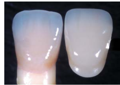
Abb. 4: Farbmodifikation durch rosafarbenen Zement (Farbe 15): Es entsteht ein lebendiger Eindruck!

zutreffen; es wurden zumindest keine Pulpairritationen festgestellt (Lervik 1978, Brannstrom und Nyborg 1977). Beim Glasionomerzement konnte jedoch mithilfe der Laser-Doppler-Flussmessung das Gegenteil festgestellt werden! Nach der Applikation von Glasionomerzementen, die mit einer Polyacrylsäure angerührt werden, war eine signifikant höhere pulvale Mikrozirkula-