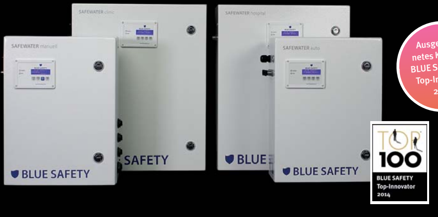
SAFEWATER-Systeme entfernen Biofilm in Dentaleinheiten gründlich und verhindern eine Neubildung.

Gebrauch gelten jedoch zu Recht diverse weitere Gesetze und Vorgaben zur Infektionsprävention. Zu nennen sind hier die Trinkwasserverordnung, das Medizinproduktegesetz, die Vorgaben des RKI (Robert Koch-Instituts) und das Infektionsschutzgesetz. Hinzu kommen die jährlichen Überwachungen und Probenentnahmen der Gesundheitsämter. Klinik- und Praxisbetreiber stehen diesem komplexen Thema oftmals hilflos und auch unzureichend informiert gegenüber. Speziell wenn es um die Beurteilung der Wirksamkeit von Wasserdesinfektionslösungen geht.