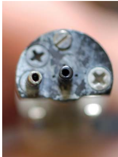
Biofilm und Kalkablagerungen an der Luft-Wasser-Spritze.

Nahezu alle Verfahren der Wasserdesinfektion in Dentaleinheiten sind mit