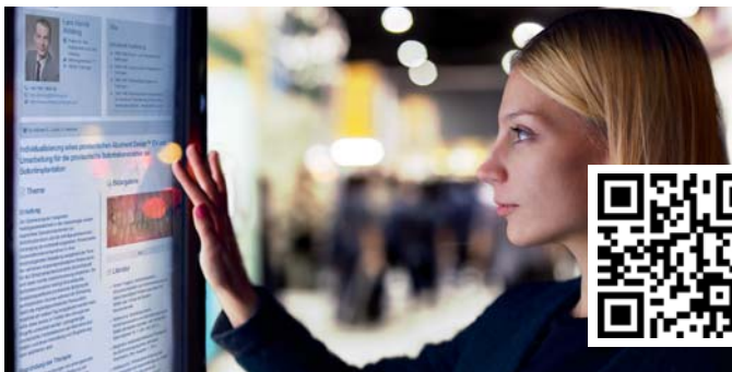
Website – Digitale Poster-Präsentation

Poster-Präsentationen sind ein wesentlicher Bestandteil von großen nationalen und internationalen wissenschaftlichen Kongressen. Sie finden in der Regel ganz klassisch als tatsächliche Präsentation von gedruckten „Postern“ statt. Experten und auch der wissenschaftliche Nachwuchs haben auf diese Weise die Möglichkeit, erste Ergebnisse ihrer Arbeit einem breiteren Fachpublikum vorzustellen. Die gängigen Poster-Präsentationen sind aber z.B. in Bezug auf das Layout, die Informationstiefe, die Möglichkeit der Verbreitung sowie in Bezug auf das Umfeld der Präsentationen recht ineffizient und im digitalen Zeitalter nicht mehr up to date.