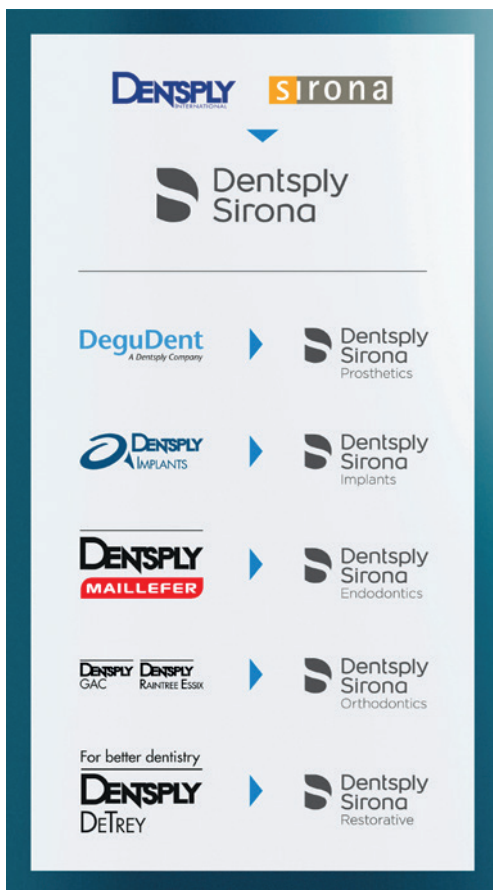
Abb. links: So sind die Geschäftsbereiche von vormalig DENTSPLY in die Bereiche von Dentsply Sirona übergegangen. Messebesucher finden diese in Halle 11.2 wieder.

kann: Das Konzept umfasst alle Phasen der dentalen Implantologie und formt sie zu einem integrierten Prozess. Es beginnt mit einer sicheren Diagnose über eine 3D-Röntgenaufnahme sowie einer anschließenden digitalen Abformung mit CEREC.