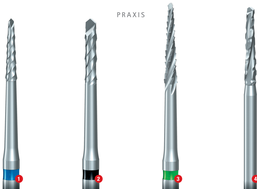
Abb. 1: Der kreuzverzahnte H254E, 6 mm lang, 1,2 mm konisch: grazil, schnittfreudig, auch für extrem dünne Schnitte geeignet. Abb. 2: Der kreuzverzahnte H255E, zylindrisch: wie der konische H254E, aber mit höherer Schnitffreudigkeit insbesondere an der Instrumentenspitze. Abb. 3: Der H162SL, 8 mm lang, 1,4 mm konisch: besonders schnittfreudig durch spezielle Sägeverzahnung. Abb. 4: Der H162ST, 9 mm lang, 1,6 mm konisch: schnittschärfster Knochenfräser in der typischen Lindemann-Dimension. Innovative Komet ST-Verzahnung, erstmals vorgestellt im März 2015.