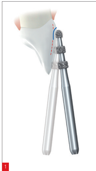
Abb. 1: Ein zylindrischer Tiefenmarkierer (im Hintergrund dargestellt) würde im zervikalen Bereich schnell zu tief eindringen und so Dentin freilegen, wie die gestrichelte rote Linie verdeutlicht. Konische Tiefenmarkierer wirken diesem Problem entgegen.

Diesem Phänomen wirken konische Tiefenmarkierer wie die Figur 868B von Komet entgegen, indem sie eine bestmögliche Kontrolle der Eindringtiefe erlauben (Abb. 1). Entwickelt wurden die Instrumente in Zusammenarbeit mit dem national und international anerkannten Experten Priv.-Doz. Dr. M. Oliver Ahlers, der als klinischer Leiter des CMD-Centrum Hamburg-Eppendorf tätig und als renommierter