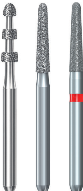
Abb. 2: Eine Auswahl der im Set 4388 enthaltenen formkongruenten Instrumente, die nacheinander eingesetzt werden. Abb. 3: Das Set 4388 von Komet.