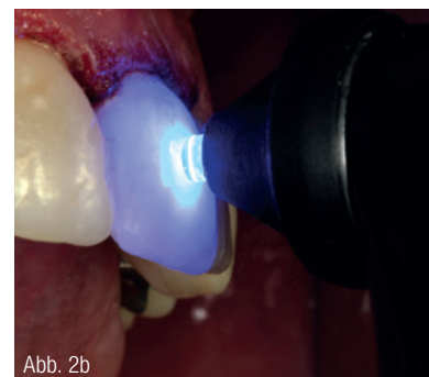
Abb. 2a: PointCure™ Lens. Abb. 2b: Klare Linse für die punktförmige Aushärtung kleiner Kompositfüllungen oder die „fixierende“ Befestigung von Veneers.