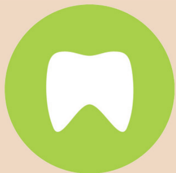
Das runde Zahnsymbol ist Teil des neuen Unternehmensauftritts von Kulzer.

Entwicklung aus. Auf der IDS präsentiert sich Kulzer erstmals auf großer Bühne im neuen Design. Die japanische Mitsui Chemicals Group hatte die Dentalsparte von Heraeus vor dreieinhalb Jahren übernommen. Die starke Mutter eröffnet Heraeus Kulzer neue Marktchancen sowie geografische und technologische Synergien. Mit der Namensänderung positionieren sich die Hanauer künftig unabhängig vom früheren Eigner und richten sich auf Wachstum aus. Mitsui Chemicals unterstützt den neuen Kurs und den Ausbau von Service und Entwick-