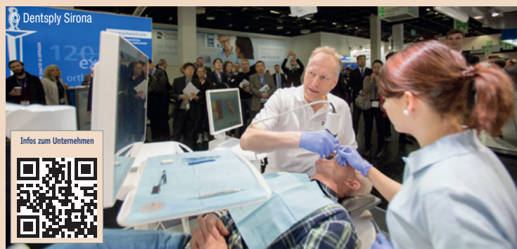
Dentsply Sirona auf der IDS in den Hallen 10.2 und 11.2: Auf zwei Bühnen werden pro Tag ca. 20 Live-Behandlungen am Patienten gezeigt.

Dentsply Sirona auf der IDS 2019 in Köln.