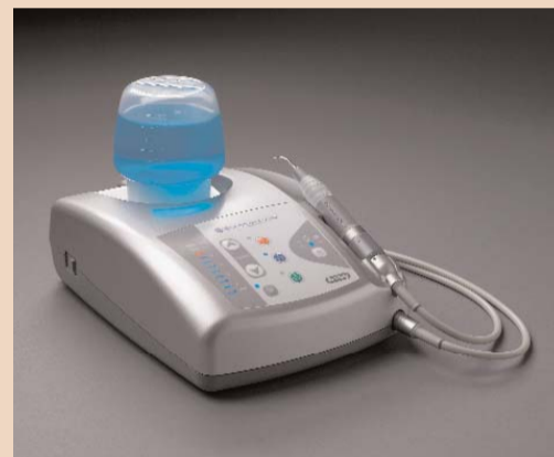
Entwickelt für Behandler und Patienten.

Zum anderen können qualitativ hochwertige Instrumente und Geräte erheblich dazu beitragen, kontrollierter zu arbeiten und dadurch das Behandlungsergebnis und den Patientenkomfort zu ver-