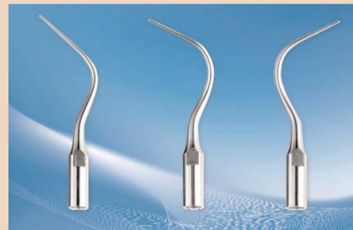
Eine große Auswahl an feinen Spitzen erlaubt individuelles, zielgerichtetes Arbeiten. Symmetry-Spitzen sind mit allen gängigen Scalern kompatibel.

bessern. Eine Scaling-Lösung, mit der Tracey Lennemann sehr gute Erfahrungen gemacht hat, ist Symmetry IQ von Hu-Friedy. Sogar die empfindlichsten Patienten reagieren positiv auf die Behandlung mit dem Ultraschallscaler, dessen