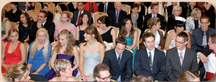
43 Absolventen warten gut gelaunt auf ihre Diplome.

Mit einer Diplomfeier und anschliessendem Ball begann am 24. September 2010 das Berufsleben für die jungen Zahnmediziner der ZZMK Zürich im Hotel Marriott.