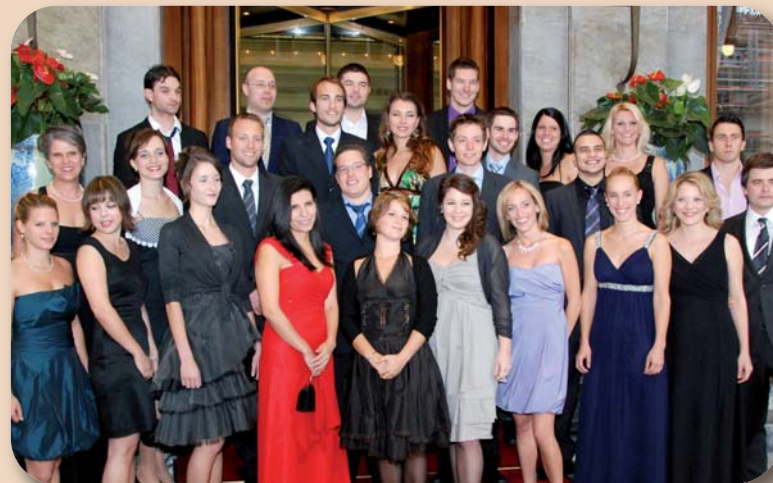
Die Absolventen 2010 der ZMK Bern auf der Treppe des Hotels Bellevue.