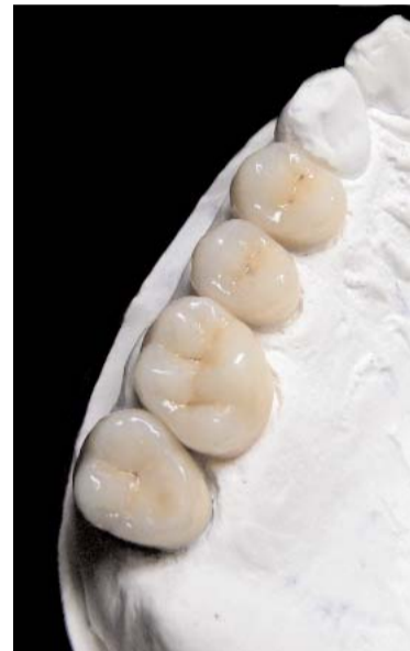
Abb. 4 und 5: Die fertigen Kronen auf dem Modell.

chen wir also ein „vollkommenes“ Ergebnis?