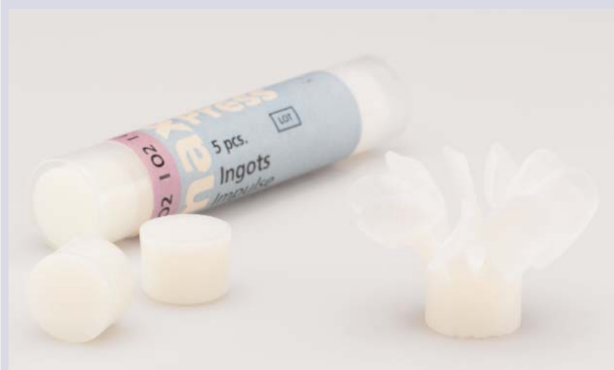
Veneer-Versorgung mit den neuen IPS e.max Press Impulse Opal-Rohlingen

lung von Teilkronen, Einzelkronen und Brücken zum Einsatz. Dank der unterschiedlichen Helligkeitseffekte ist es möglich, die Restauration optimal in den Restzahnbestand zu integrieren. Dabei