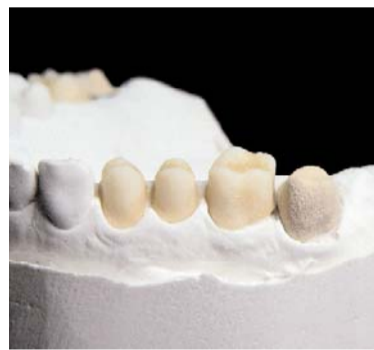
Abb. 2: Opaquer wird ausreichend deckend aufgetragen.