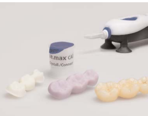
Die IPS e.max CAD-on-Technik. Im Vordergrund: Die IPS e.max CAD-Verblendstruktur, das IPS e.max ZirCAD-Gerüst und die fertige IPS e.max CAD-on-Brückenrestoration. In der Mitte: Die Fügeglaskeramik IPS e.max CAD Crystall./Connect. Im Hintergrund: Das Vibrationsgerät Ivomix.

ZirCAD sowie eine Lithium-Disilikat-Verblendstruktur aus IPS e.max CAD. Beide Teile werden mittels der neuen intuitiven Sirona inLab Software V3.80 konstruiert und im Sirona inLab MC-XL geschliffen. Die Sinterung des IPS e.max ZirCAD-Gerüsts erfolgt