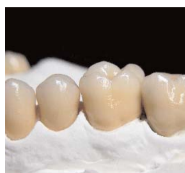
Abb. 3: Vollkeramische Restauration.