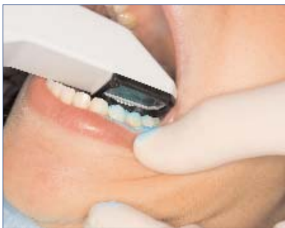
Scannen ohne Puder. Die sogenannte konfokale Scantechnik ermöglicht sowohl eine supra- als auch die subgingivale Erfassung der Präparation.

Die gesteigerte Patientenzufriedenheit und höhere Präzision bringen nach Meinung des Dentalunternehmens Straumann, das seit Frühjahr 2010 Vertrieb und Support für Cadent iTero übernommen hat, beträchtliche Zeit- und Kostenersparnisse. Als Spezialist für digitale Arbeitsabläufe sehen die Freiburger dieses System als optimale Ergänzung in den Prozessen der CAD/CAM-Technologie. So können die generierten Daten der digitalen Abformung an die Straumann Cares Visual 6.0 Software im Dentallabor weitergeleitet und dort verarbeitet werden. Der gesamte Arbeitsablauf bis hin zur fertigen Krone ist damit reibungslos und komplett digital.