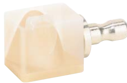
VITABLOCS Reallife ermöglichen eine absolute naturgetreue Frontzahnästhetik per Mausclick.

BLOCS Mark II gefertigt. Erhältlich sind die Blocks in der Geometrie RL-14/14 (14 x 14 x 18 mm). Das Farbangebot gemäß dem VITA SYSTEM 3D MASTER umfasst zu-