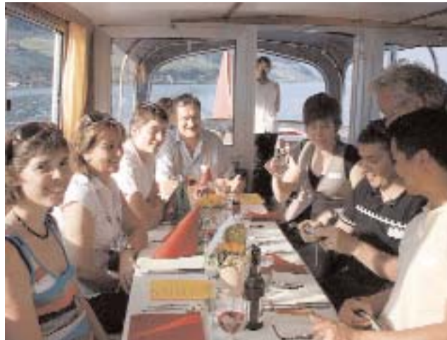
Auf der MS Bielersee.

Nebst den jungen Meistern begrüßte er ebenso die anwesende Sponsorengruppe und dankte für die überaus wertvolle Unterstützung der Weiterbildung.