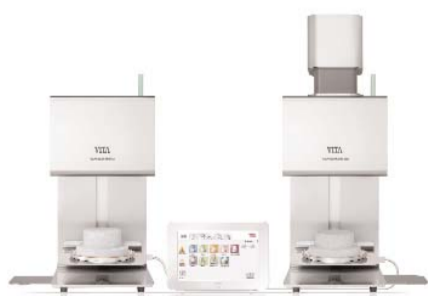
VITA VACUMAT „New Generation“

Noch mehr Flexibilität wird jetzt durch die Einführung zusätzlicher Module – den Kombipressofen VITA VACUMAT 6000 MP – geboten, der ebenfalls über VITA vPad comfort und VITA vPad excellence bedienbar ist. Der Kombipressofen verfügt über