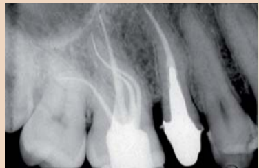
Wurzelkanalbehandlung bei Zahn 16. PathFile™ macht die Kanäle in nur wenigen Sekunden perfekt durchgängig, im Einklang mit ihrer ursprünglichen Anatomie, selbst in diesem sehr anspruchsvollen Fall.

PathFile besteht aus extrem bruchfesten und flexiblen NiTi-Instrumenten mit einer Konizität von zwei Prozent. Sie werden in drei verschiedenen Längen und drei verschiedenen Spitzengeometrien (ISO 013/016/019) angeboten. Damit stehen rotierende Instrumente zur Verfügung, mit denen Wurzelkanäle in wenigen Sekunden und absolut sicher durchgängig gemacht werden können, bevor die ei-