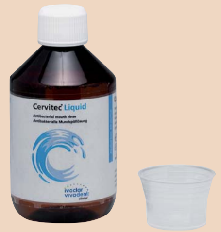
Die alkoholfreie, antibakterielle Mundspüllösung Cervitec Liquid von Ivoclar Vivadent.

Entzündungen des Zahnfleisches, der Mundschleimhaut sowie des Zahnhalteapparates und Infektionen im Mund. Darüber hinaus kommt Cervitec Liquid vor und nach implantologischen, parodontalen, zahn- oder kieferchirurgischen Eingriffen zum Einsatz – sowie bei hohem Kariesrisiko, bei eingeschränk-