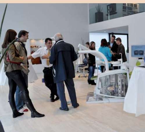
Während des Nachmittags und Abends war die Kavo-Ausstellung in Safenwil immer gut besucht.

Es war aber keineswegs so, dass die „Bubenträume“ zu stark von den Geräten ablenkten. Modernes Industrie-Design muss sich heute nicht mehr verstecken. Ob Sportwagen oder Behandlungseinheit: Hier wie dort steckt unter der edlen Verkleidung modernste Technik