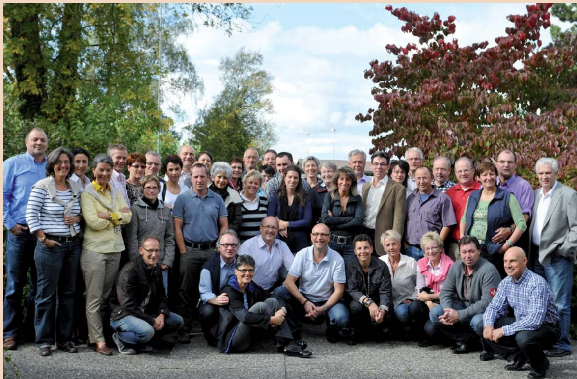
Der Club 50 bei seinem Ausflug ins Berner Seeland.

legiale Zusammensein stand im Vordergrund. Wie auf den Fotos zu sehen ist, es hat allen gut gefallen. DT