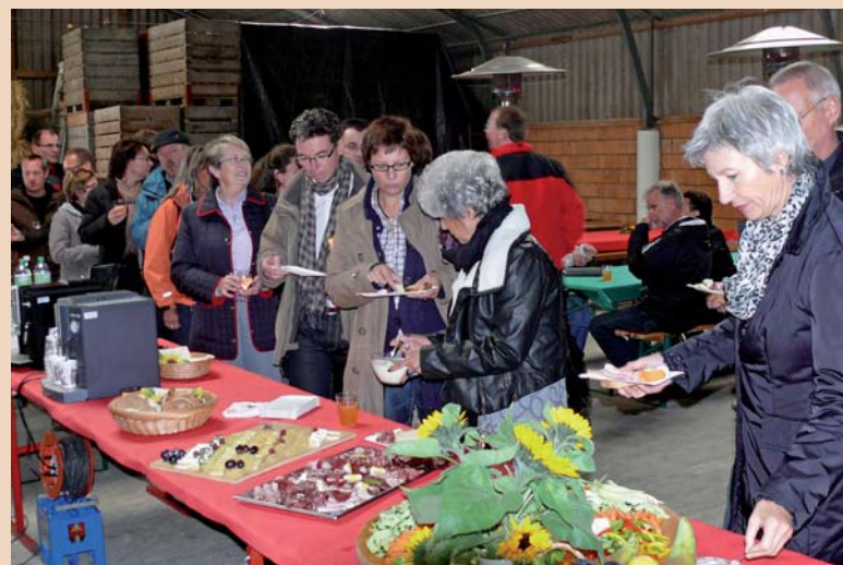
Auf einem Seeländer Bauernhof gab es eine Zwischenverpflegung.