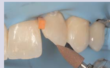
Politur der Präparation mit Silikonspitze.