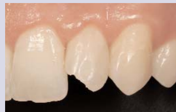
Ausgangssituation mit Status nach Trauma.