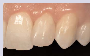
Resultat im Recall (4 Monate).