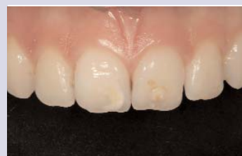
Ausgangssituation mit hypoplastischen Schmelzarealen.