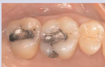
Ausgangssituation mit insuffizienten Amalgamfüllungen.