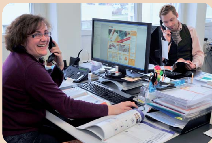
Das Team vom Kundenservice betätigt im neuen Büro in Illnau in den drei Landessprachen.

Länggstrasse 15 8308 Illnau-Effretikon Tel.: 0800 002 300 Fax: 0800 002 006 kontakt@mwdental.ch www.mwdental.ch