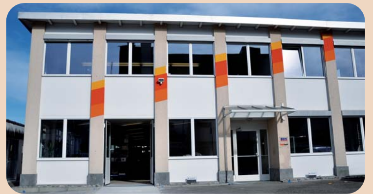
Das neue M+W-Betriebsgebäude in Illnau-Effretikon.

dass nicht im Katalog aufgeführte Produkte beschafft werden. Insgesamt kümmern sich 204 Mitarbeiterinnen und Mitarbei-