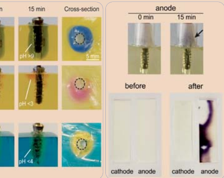
Elektrochemischen Implantatbehandlung. Fotografische Dokumentation bei der Verwendung von pH-sensitiven Farben zur Visualisierung für Thymolblau: pH über 9 (alkalisch), Pink: pH unter 3 (sauer), grüne Farbe (Bromkresolgrün) erlaubte die Abbildung eines Weichspottes, das sich entwickelte sich ein homogener und kreisförmiger Weichspottlöcher. – Grafik 2: Produktion von oxidativen Spezies in vitro und nach der Behandlung der Implantate in simuliertem Mundmilieu nach der Elektrolyse.

Originalarbeit: Mohn D, Zehnder M, Stark WJ, Imfeld T (2011): Electrochemical Disinfection of Dental Implants – a Proof of Concept. PLoS ONE 6(1): e16157. doi:10.1371/journal.pone.0016157