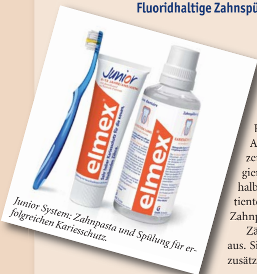
Junior System: Zahnpasta und Spülung für erfolgreichen Kariesschutz.

Fluoridhaltige Zahnpflege als Ergänzung erhöht den Kariesschutz