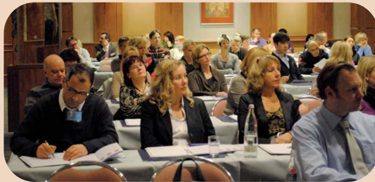
Auf grosses Interesse stiess der 2. Deutsche Halitosis-Tag in Berlin.

Warum Ludwig XIV. laut historischen Quellen unerträglichen