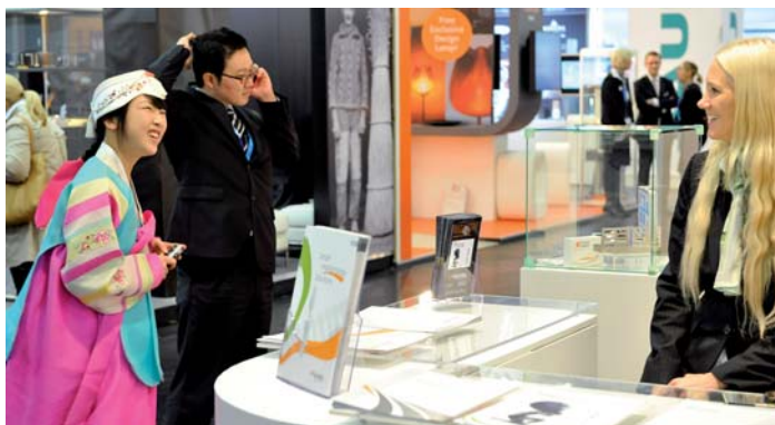
Tradition und Moderne – auch Besucher aus fernen Ländern informiert sich.