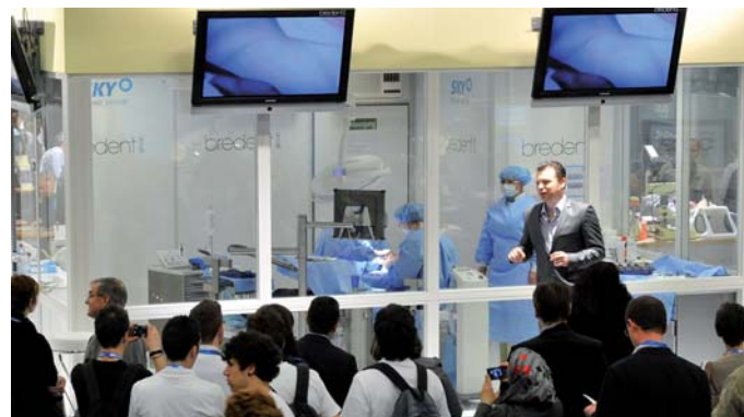
Die Live-OP's waren immer stark umlagert.