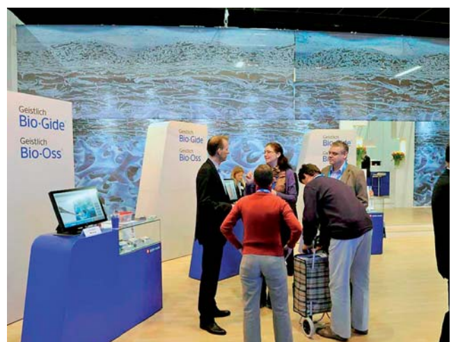
Die Extraktionsalveolen waren das Thema bei Geistlich Biomaterials.