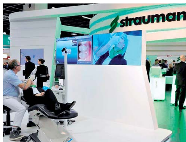
Straumann – ein Publikumsmagnet. Präsentierte die gesamte Produktlinie.