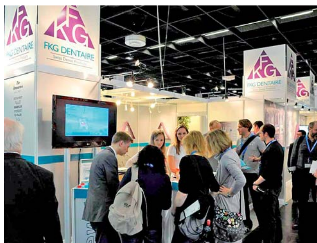
FKG Dentaire, der Endospezialist mit grösserem Stand und viel Publikum