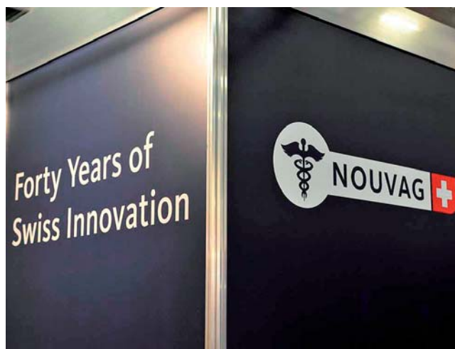
40 Jahre Nouvag. Präsentierte neue Motorsysteme für Chirurgie und Endo.