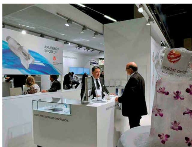
Thommen Medical verwöhnte die Gäste mit Musik und Molekularküche.