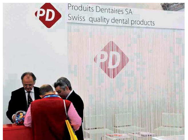
Produits Dentaires. Produkte für Endo, Restaurationen, Hygiene, Medical.