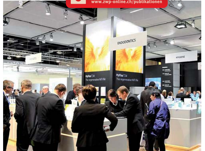
Am Stand von Coltene/Whaledent mit Live-Demonstrationen.