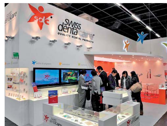
Swiss denta care, das neue Unternehmen präsentierte sich erstmals.