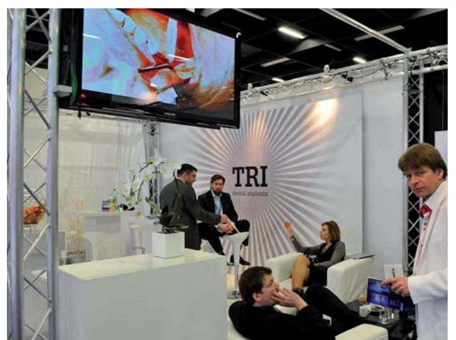
TRI Dental Implants, ein neuer Implantatanbieter aus der Schweiz.