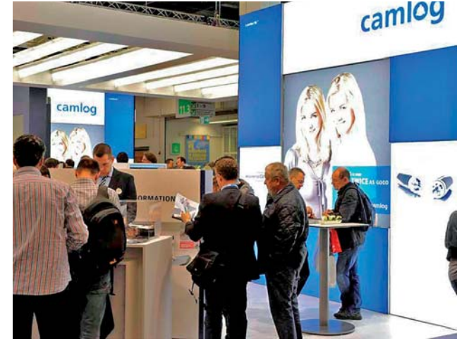
Die „Zwillinge“ Camlog und Conelog im Mittelpunkt der Präsentation.

Bildergalerie in der E-Paper-Version der Dental Tribune Swiss Edition unter: www.zwp-online.ch/publikationen