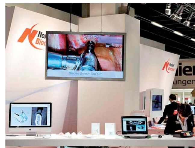
Nobel Biocare mit interaktivem Messeauftritt. Vorträge und Live-Demos.