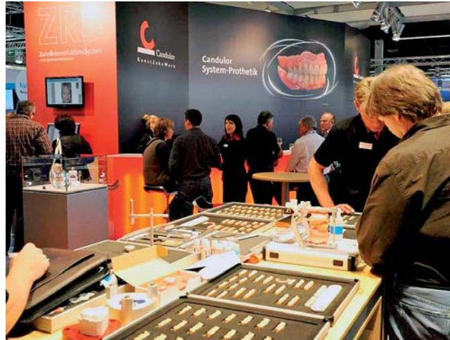
Zahntechniker und Zahnärzte informierten sich bei Candolor.