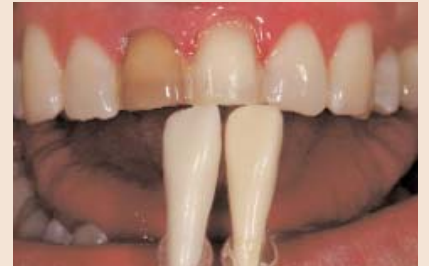
FALL 5 Gepresste Veneers oder geschichtete Veneers (auf Folie oder feuerfesten Stümpfen)?