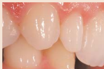
Es ist bekannt, dass die Mukose das Zirkonoxid aus biologischer Sicht liebt. Bei geringen Platzverhältnissen konnte in diesem Fall ein echter Erfolg erzielt werden. Die Arbeit ist bereits 4 Jahre in situ.