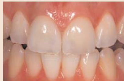
Die Entscheidung fiel auf Zirkonoxid. Die zervikal hohe Helligkeit und die schwarze Insel konnte mit einer 0,6er Kappe sowie Mi61 geblockt werden. Das Ergebnis der Zirkonoxidkrone (11) im Vergleich zum Veneer (21) ist gelungen.