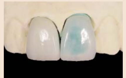
In diesem speziellen Fall wurden feuerfeste Creationveneers aufgrund der sehr geringen und unterschiedlichen Platzverhältnisse bevorzugt.