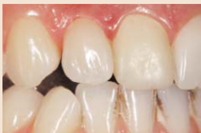
Oft – besonders bei sehr dünnen Veneers und mittel bis stark verfärbten Zahnstümpfen – kleben wir zuerst das Veneer, um eventuelle optische Veränderungen des Veneers nach dem Kleben berücksichtigen und in die Phase der Kronenherstellung mit einbeziehen zu können.