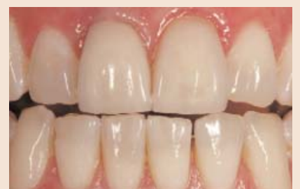
Zervikal hätte der Behandler am 11 subgingival noch tiefer präparieren können, um die distale Schattenzone besser zu kaschieren.