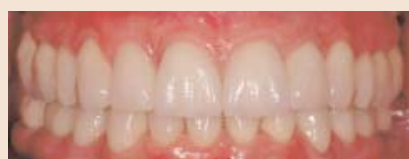
Je grösser ein Fall wird (bis hin zur Totalsanierung), desto mehr verwende ich im Seitenzahnbereich die VMK-Technik und im Frotzahnbereich die Voll- oder Zirkonoxidkeramik, da dies insbesondere im zervikalen Bereich für mich am besten händelbar ist. Bei devitalen Stümpfen oder Goldaufbauten mit geringem Platzangebot für die Verblendmasse gibt es nur die bewährte VMK-Technik.