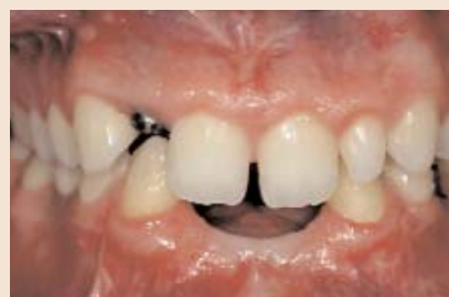
FALL 4 Der erste Eindruck ist hier sofort: Titanabutment/VMK-Technik, um genügend Stabilität zu erreichen. Dieser Fall fiel aber an der Universität Zürich in eine Zirkonoxidstudie, somit wurde ein Zirkonoxidkeramikabutment mit Aluminiumoxidkrone darauf hergestellt.