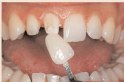
FALL 1 Hier bestand der Auftrag, für Zahn 12 ein Veneer und für Zahn 11 eine Krone zu erstellen.