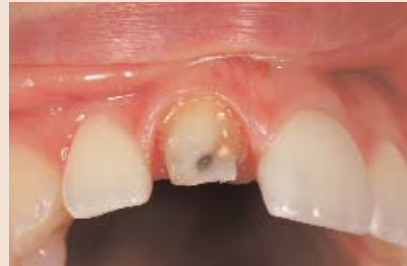
FALL 3 Die Ausgangssituation: Es bedarf zervikal einer hohen Helligkeit und einer inzisalen Blockung der deutlich zu sehenden schwarzen Verfärbung. Vorgehen mittels VMK-Technik oder Zirkonoxid?