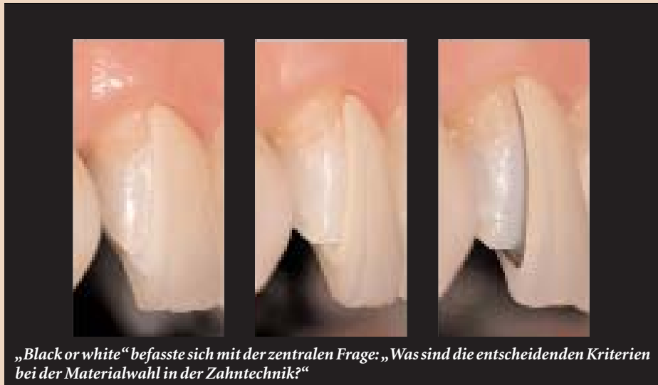
„Black or white“ befasste sich mit der zentralen Frage: „Was sind die entscheidenden Kriterien bei der Materialwahl in der Zahntechnik?“