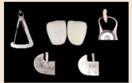
Grosser Spielraum im Aufbau: Von 0,01 mm bis hin zu 0,7 mm kann entschieden werden, in welcher Dicke und in welcher Verschiedenheit die Masse aufgetragen werden soll.