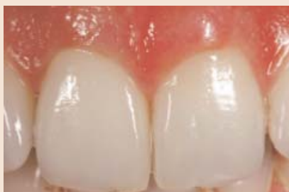
Bei hoher Helligkeit des natürlichen Zahnes arbeite ich sehr gerne mit der Zirkonoxidtechnik.