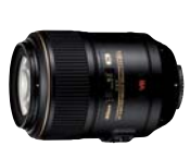
AFS VR Micro 105 mm