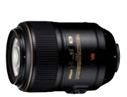
AFS VR Micro 105 mm