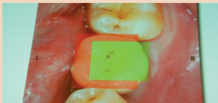
Schutz vor Abplatzungen: Okklusionskontakte nur im grünen Bereich (Fossa oder zentraler Höcker), Schleifkorrekturen müssen perfekt poliert werden.