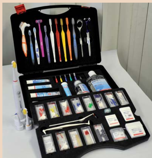
Flexi-Grip, nicht nur auf dem Papier „made in Switzerland“.