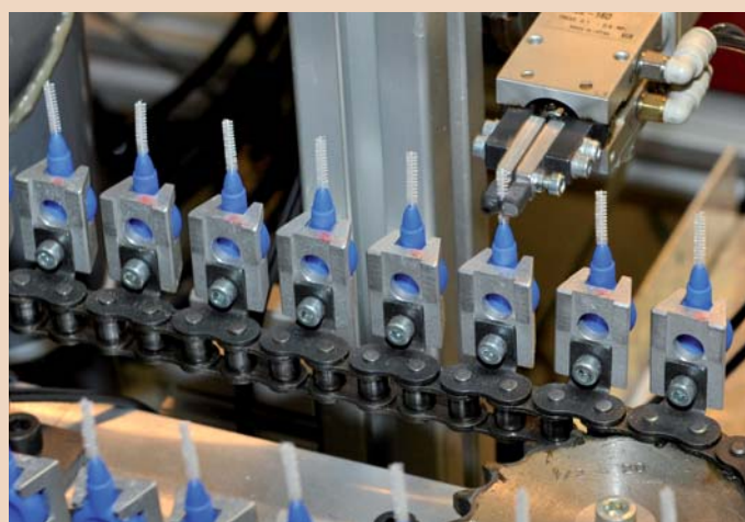
Das komplette Prophylaxe-Sortiment, für jeden Anwendungsbereich die passende Auswahl.