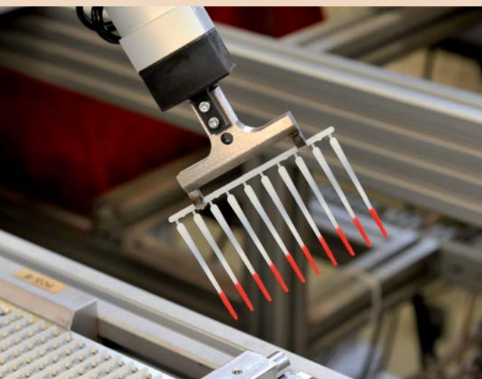
Das Original, paro Brush-Sticks in der hochautomatisierten Serienfertigung.