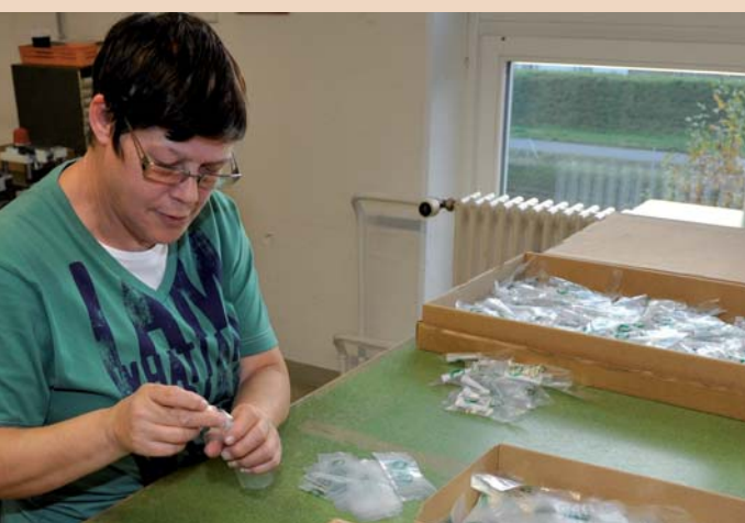
Kleinserien werden von Hand konfektioniert, Schweizer Qualitätsarbeit für Schweizer Kunden.