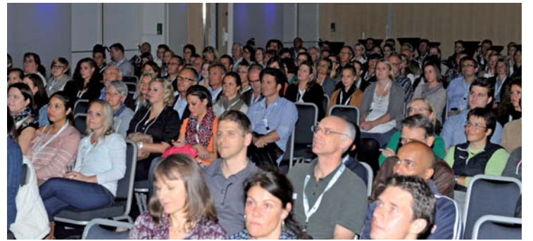
Über 400 Gäste kamen zur Kundentagung der Martin Engineering AG nach Oerlikon.