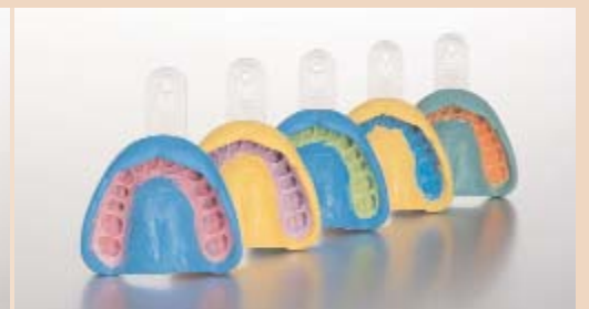
Links: Die Familie der Imprint™ 4 Vinyl Polysiloxan Abformmaterialien bietet ein dank einzigartiger aktiver Selbsterwärmung beschleunigtes Abbindeverhalten und dadurch die im Marktvergleich kürzeste Mundverweildauer. Oben: Die einzigartigen Eigenschaften der Imprint™ 4 Vinyl Polysiloxan Abformmaterialien ermöglichen höchste Abformpräzision für perfekt sitzende Restaurationen.

phile Verhalten von Imprint™ 4 verantwortlich und gewährleistet, dass das Abformmaterial bereits im ungebundenen Zustand ausserordentlich hydrophil ist. Gleich zu Beginn, wenn das Material mit dem feuchten Mundmilieu in Kontakt gerät, kommen die hervorragenden Fliesseigenschaften von Imprint™ 4 Abformmaterial zum Tragen und ermöglichen die