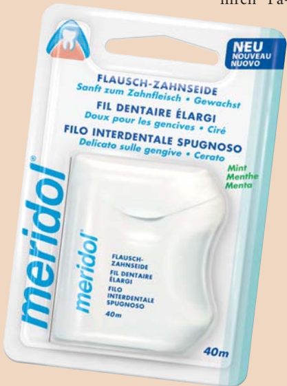
meridol Flausch-Zahnseide für gereiztes Zahnfleisch.

tienten dieselbe ans Herz legen. Ein Grund für die zögerliche Akzeptanz dieses Ratschlags mag in der Tatsache begründet liegen, dass die Verwendung konventioneller Zahnseide bei bereits gereiztem Zahnfleisch unangenehm sein kann.