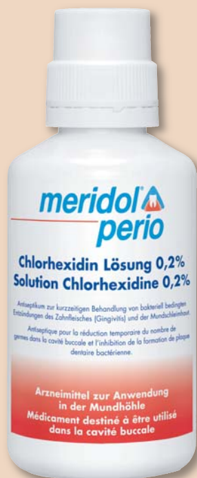
CHX-Mundspülung wieder im Handel.

Zur Abrundung der Behandlung während einer CHX-Therapie ist eine Zahnpasta ideal, die kein Natriumlaurylsulfat (SLS) enthält und somit die Wirkung des Chlorhexidins nicht beeinträchtigt (z.B. meridol® Zahnpasta). Nach Beendigung der Therapie sollte für die Langzeitanwendung ein System aus Zahnpasta, Zahnbürste und Mundspülung zum