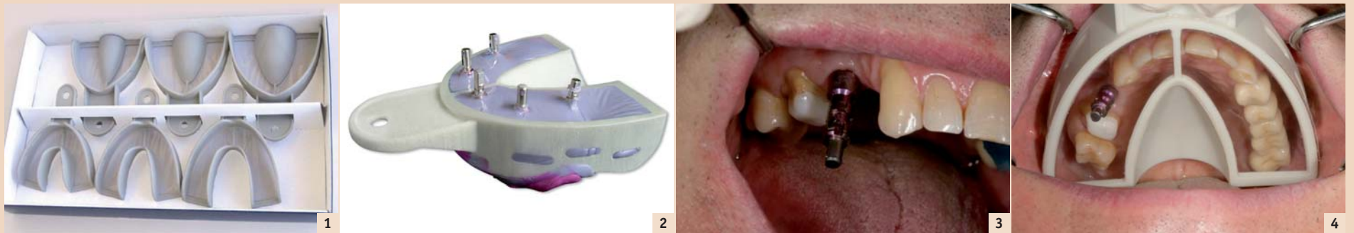
Abb. 1: Miratray® Implant für Ober- und Unterkiefer, erhältlich in klein, medium und gross. – Abb. 2: Kompletter Oberkieferabdruck für fünf Implantate mit Miratray® Implant nach intraoraler Entfernung. – Abb. 3: Abdruckabument offener Löffel auf einem Implantat, zweiter Prämolare. – Abb. 4: Miratray® Implant, eingesetzt zur Demonstration des Abdruckabuments im Löffel mit Abdruck des gesamten Oberkiefers.

An der Universität Aachen wurde ein neuer Abdrucklöffel mit Folientechnik für die Implantologie entwickelt. Die Methode ermöglicht eine schnelle, leichte, saubere und präzise Positionierung der Implantate. Von Dr. Gregori M. Kurtzman, Maryland, USA.