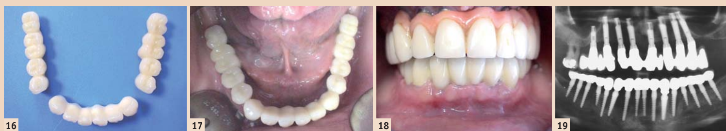
Abb. 16: Definitive Kronenblöcke. – Abb. 17: Okklusalanalysen. – Abb. 18: Frontalanalysen. – Abb. 19: Kontroll-OPG ca. vier Jahre post-OP.

Durch das Überdenken allgemeingültiger Implantationsregeln, die überwiegende Verwendung minimalinvasiver Implantationstechniken und einteiliger Implantate ist es möglich, das Ziel schmerzärmer und schneller zu erreichen. Aufgrund der wenigen Arbeitsschritte durch das implantologische Team und das Labor belaufen sich die Kosten dafür, trotz einer wesentlich grösseren Implantatanzahl, auf 20 bis 50 Prozent unter denen der klassischen Implantologieverfahren. ■