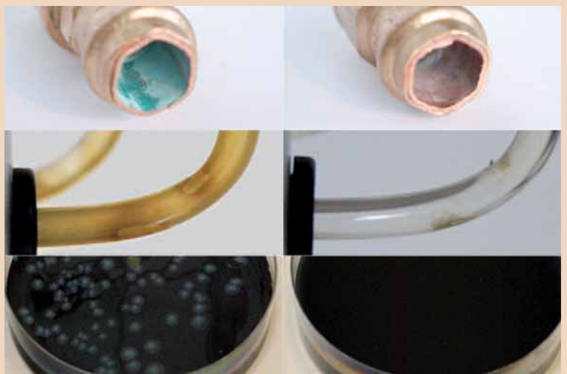
Biofilm in Hausinstallationen – vor Einsatz von SAFEWATER und nachher.

zudem Kooperationen mit namhaften und innovativen Anbietern eingehen, die gleiche Qualitätsziele verfolgen, wie z. B. der goDentis-Gesellschaft für Innovation in der Zahnheilkunde mbH in Köln.