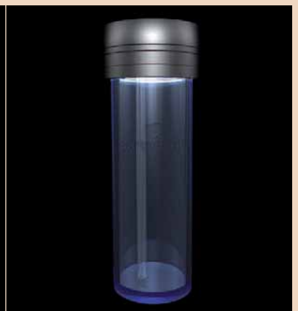
Das innovative Bottle-Care-System von BLUE SAFETY.