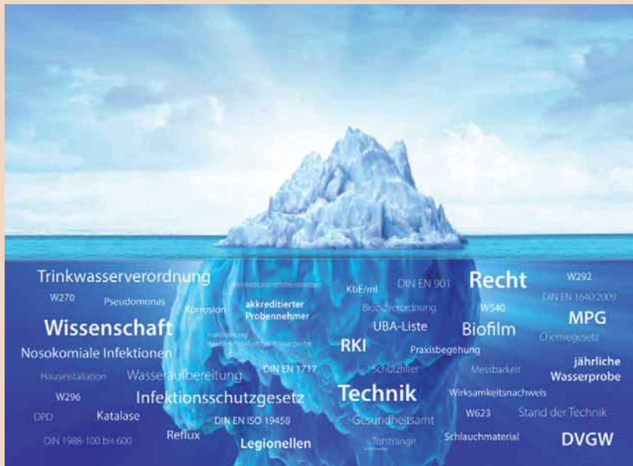
Das komplexe Thema der Wasserhygiene: Unsichtbare Gesetze, Verordnungen und Gefahrenquellen.

J. P.: Der Erfolg von Desinfektionsmassnahmen lässt sich nur mit korrekt durchgeführten Beprobungen nachweisen. Das ist nicht unproblematisch. Denn beim Einsatz chemischer Desinfektionsverfahren ist bei der Probenahme stets auf ein geeignetes Inaktivierungsmittel in der richtigen Konzentration in den Probenahmegefässen zu achten. Wird dies unterlassen oder nicht korrekt berechnet, ist die Analyse verfälscht. Zu lange Kontaktzeiten und die hohe Konzentration der Biozide, wie H 2 O 2 in den Probenahmegefässen reduzieren die Anzahl der aus dem Biofilm losgelösten Keime auf den Weg ins Labor erheblich. Wir haben nun das erste Probenahmegefäss entwickelt, das H 2 O 2 inaktiviert. Das Produkt stellen wir auf der IDS 2015 als eine unserer Innovationen vor.