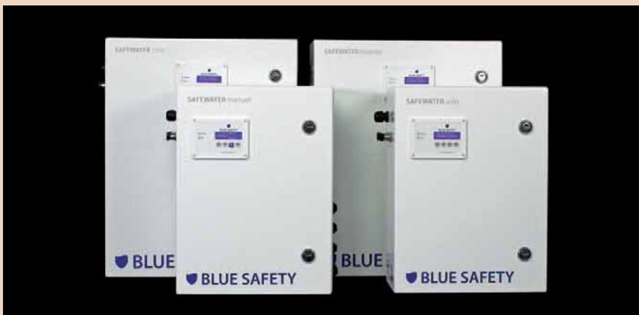
SAFEWATER-Anlagen: Einziges RKI-konformes und rechtssicheres Wasserhygiene-System in Deutschland.

Ihr Unternehmen hat seinen Hauptsitz in Münster. Gibt es dafür Gründe?