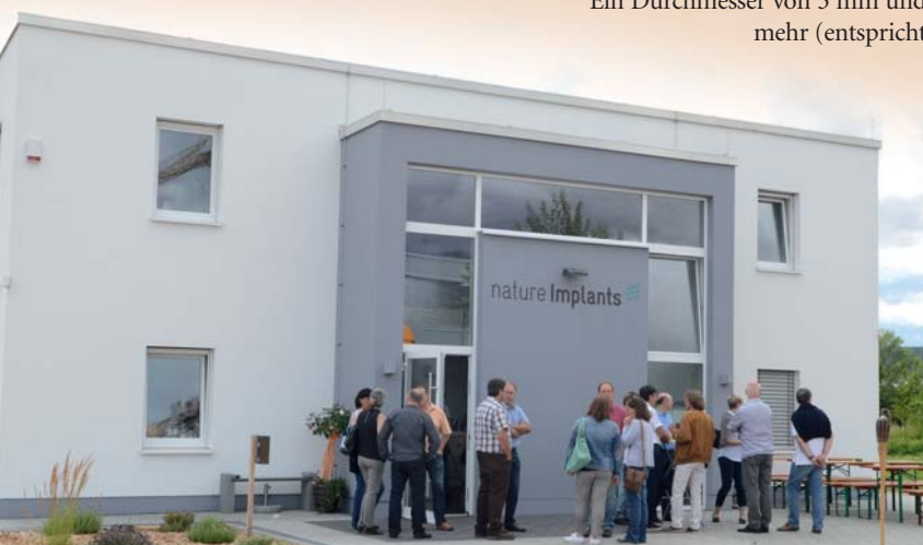
Am 25. Juli 2015 wurde der neue Firmensitz von nature Implants in Bad Nauheim eingeweiht.