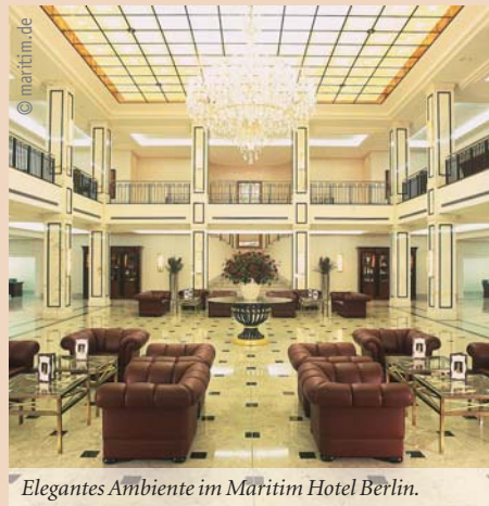
Elegantes Ambiente im Maritim Hotel Berlin.

Zahnärzte und Wissenschaftler aus der ganzen Welt kommen in die deutsche Hauptstadt, um sich über das Neueste im Bereich der dentalen Implantologie zu informieren. Neben den