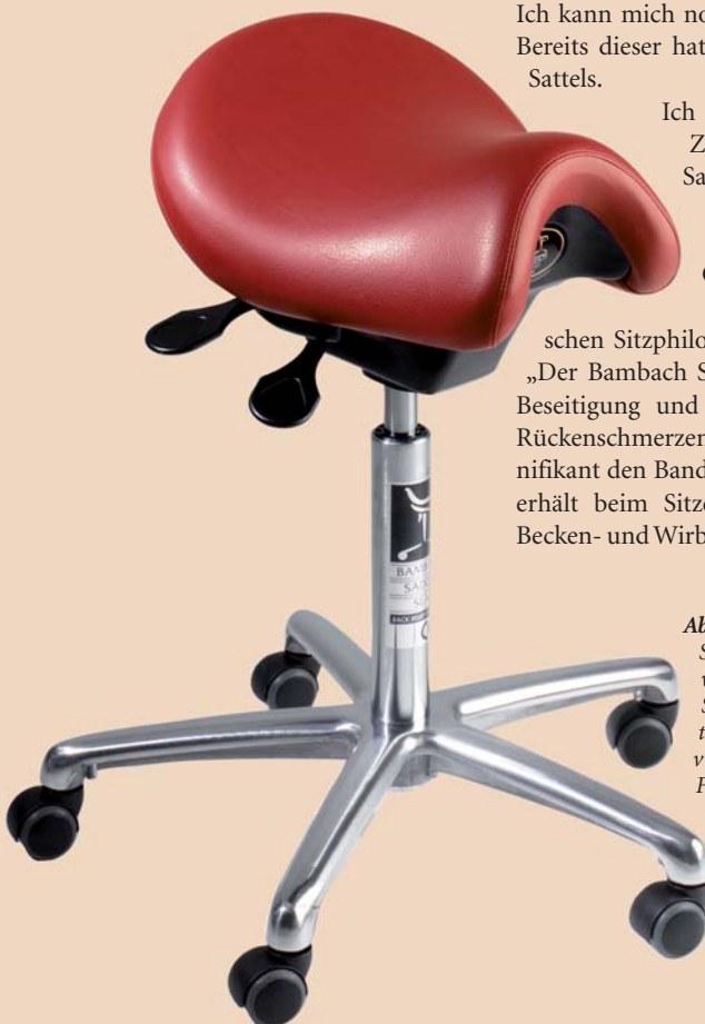
Abb. 3: Der Bambach Sattelsitz ist inspiriert von der aufrechten Sitzhaltung von Reitern. Der Stuhl ist in vielen verschiedenen Farben und Ausführungen erhältlich und passt somit in jedes Behandlungszimmer.

Ich habe vor einiger Zeit den Bambach Sattelsitz zur Erprobung bekommen und muss die Quintessenz dieser speziellen praktischen Sitzphilosophie bestätigen: „Der Bambach Sattelsitz dient zur Beseitigung und Vorbeugung von Rückenschmerzen und mindert signifikant den Bandscheibendruck. Er erhält beim Sitzen die natürliche Becken- und Wirbelsäulenposition.“