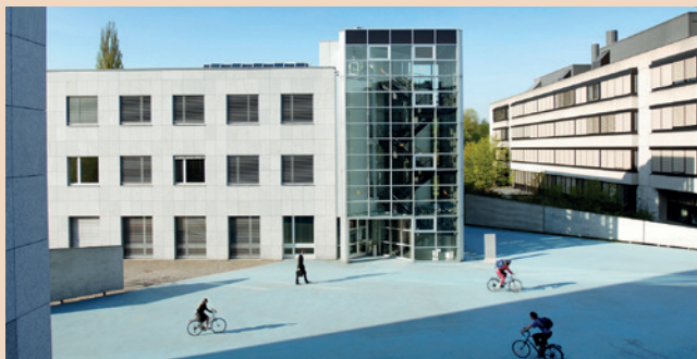
Georg Büchner Platz am Campus Irchel der Universität Zürich.

Die wissenschaftliche Vortragsreihe beginnt mit dem Beitrag „Vom