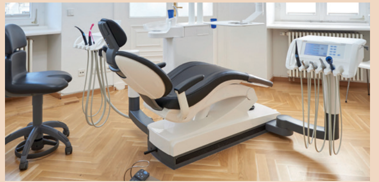
Die Entscheidung für eine neue Behandlungseinheit, zum Beispiel TENE0, ist eine für die Gegenwart und Zukunft: Effiziente Workflows sorgen für ein sicheres und komfortables Behandlungserlebnis.

„Fällt die Entscheidung auf die Anschaffung einer neuen Behandlungseinheit, gilt es, sowohl die betriebswirtschaftlichen Aspekte zu berücksichtigen als auch den täglichen Umgang mit der Einheit, der sowohl für die Behandler als auch das gesamte Praxisteam passen muss“, so Susanne Schmidinger, Leitung Produktmanagement Behandlungseinheiten. „Der Workflow an modernen, zuverlässigen Einheiten spart häufig Zeit, in der zusätzlich Patienten behandelt werden können.“ Die Erfahrungen von vielen Zahnärzten, die auf Einheiten der modernen Generation umgestiegen sind, zeigen: Diese Investitionen wirken sich positiv aus.