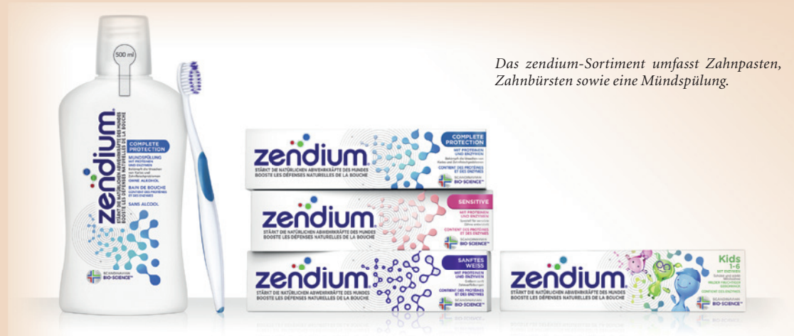
Das zendium-Sortiment umfasst Zahnpasten, Zahnbürsten sowie eine Mundspülung.